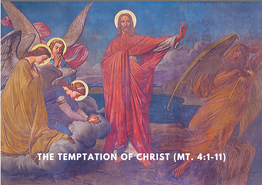
THE TEMPTATION OF CHRIST (MT. 4:1-11)

ST. MONICA PARISH LENTEN REFLECTION FEBRUARY 24, 2020, 7:00PM. – 9:00PM AT THE CHURCH This Lent we are invited to enter the desert with Jesus Christ. His temptations are likened to our human weaknesses. Our priests will guide and motivate us on ways to live victoriously over our temptations. Babysitting will be available in the nursery. For more information, contact the Parish Office, 214-358-1453.