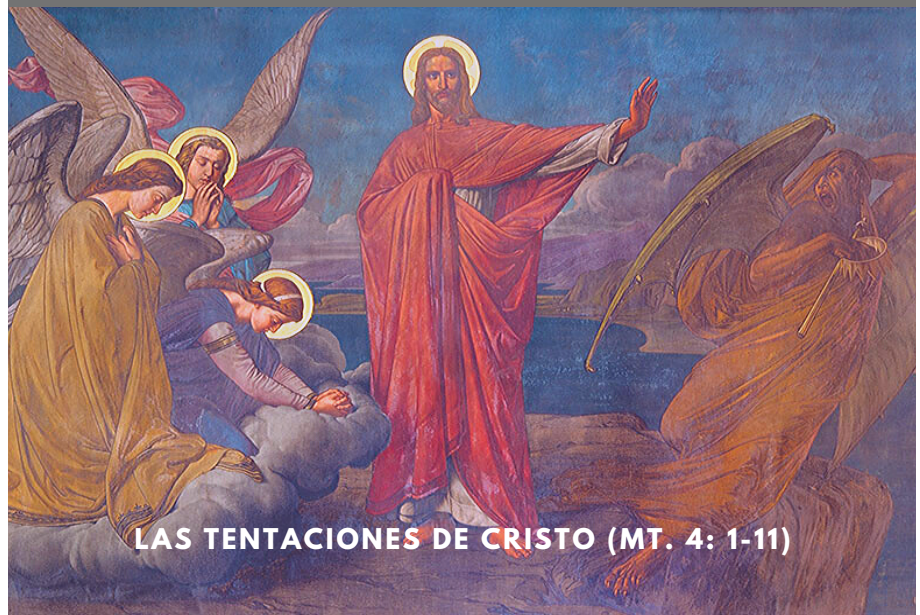
LAS TENTACIONES DE CRISTO (MT. 4: 1-11)

22 de febrero de 2020, 11:00 am – 4:00 pm Centro Familiar Salón 201. En esta Cuaresma estamos invitados a entrar al desierto con Jesucristo. En sus tentaciones se transluce nuestra propia debilidad. Prepárate para vivir tu Cuaresma participando en un día de oración y reflexión guiado por nuestros Sacerdotes. ¡Trae tu lunch y tu Biblia! Para obtener más información, comuníquese con la Oficina de Parroquial 214-358-1453 .